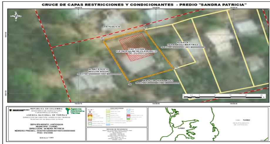
IMAGEN 2 – CRUCE CAPAS RESTRICCIONES Y CONDICIONANTES